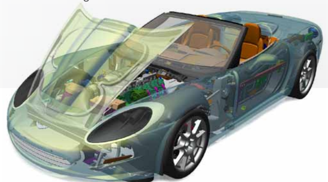
Einfaches und schnelles Weitergeben von detaillierten visuellen Informationen überall im Unternehmen.

Mit Creo View MCAD können wichtige Unternehmensdaten (z. B. Modelle, Zeichnungen und Dokumente) bei der unternehmensübergreifenden Projektzusammenarbeit mit Wasserzeichen geschützt werden.